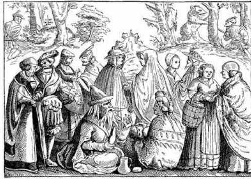
Fig. 376.—Gipsies Fortune-telling.—Fac-simile of a Woodcut in the "Cosmographie Universelle" of Munster: in folio, Baste, 1552.